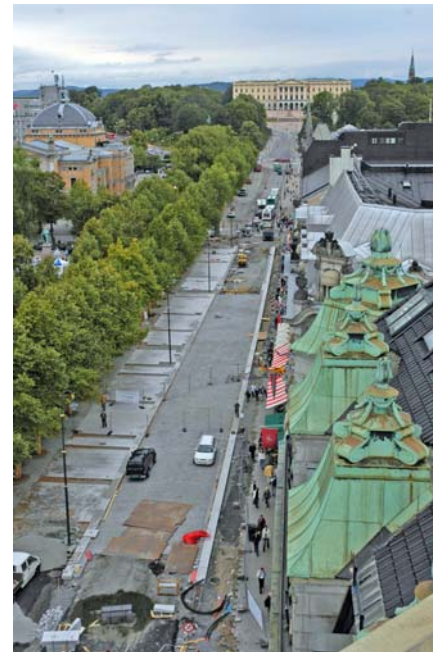
Barokk byakse, Karl Johansgate.

En eventuell senere utvidelse (2010?) av dette studiet vil kunne være å tilby en Master i Landskapsarkitektur til studenter som har en BA eller MA i arkitektur eller tilsvarende utdanning. Denne utdanningen vil kunne tilby et introduksjonskurs i LA før studentene følger den foreslåtte MLA utdanningen. Dette "forkurset" vil muligvis kunne utvikles i samarbeid med UMB.