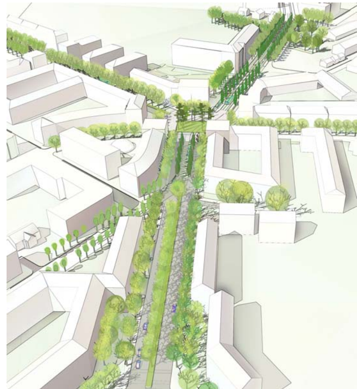
Perspektiv av nye Carl Berners plass, Snøhetta AS