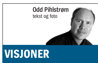
Odd Pihlstrøm tekst og foto

Howdan vil Jæren utvikle seg etter hvert som «oljeøkonomiens fotavtrykk» reduseres? En gruppe arkitekt- og landskapsarkitektstudenter fra åtte land utforsker om tendenser, endringer og nytenkning går i bærekraftig retning.