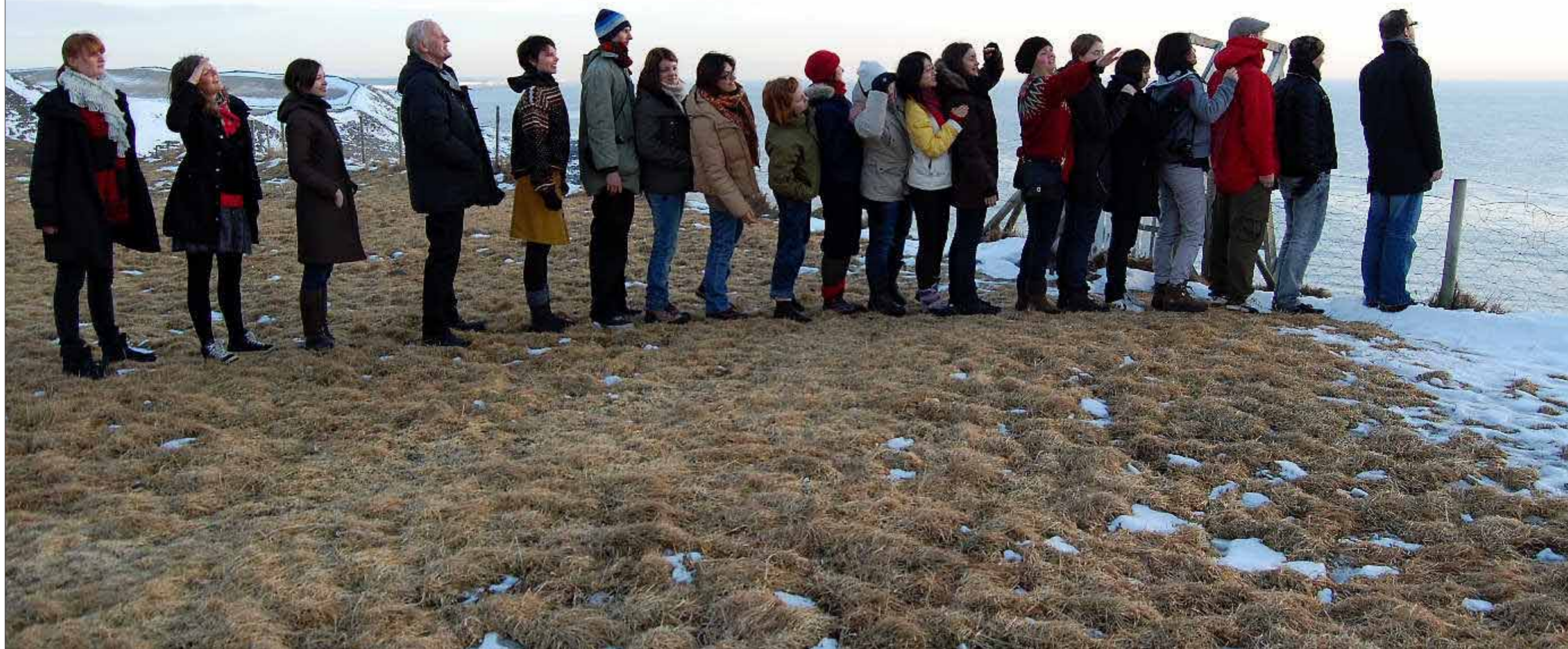
ÅPENT LANDSKAP: Jærlandskapet, her ved Obrestad fyr, er imponerende åpent – og vakkert, mener arkitektstudenter og foresatte ved Arkitektthøyskolen. Målet med ter oljeepoken.

Howdan vil Jæren utvikle seg etter hvert som «oljeøkonomiens fotavtrykk» reduseres? En gruppe arkitekt- og landskapsarkitektstudenter fra åtte land utforsker om tendenser, endringer og nytenkning går i bærekraftig retning.