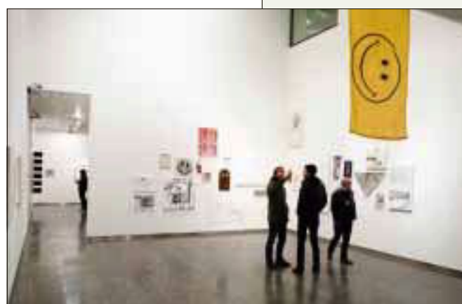
SLURVETE: «Happy Endings»