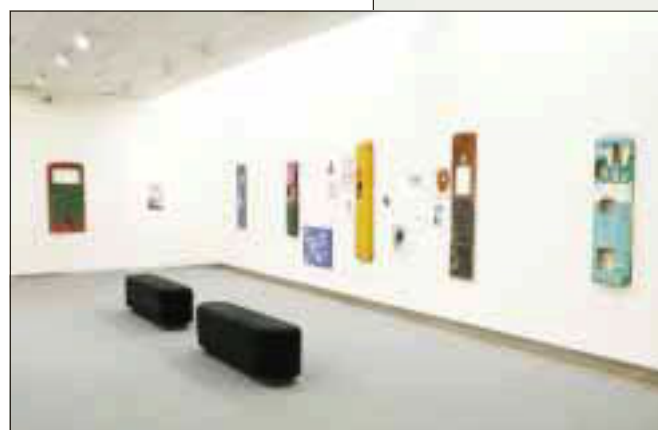
SLÅENDE: «Pump Dump»