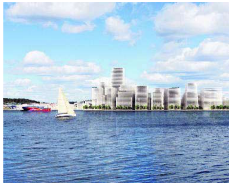
FRA SJØEN: Slik kan Lagmannsholmen bli seende ut med boliger.

– I arbeidet med oppgaven har jeg hatt et godt samarbeid med kommunen. Og det er jo en students privilegium å være visjonær og våge å utfordre byen på å skape en langt mer ambisi-